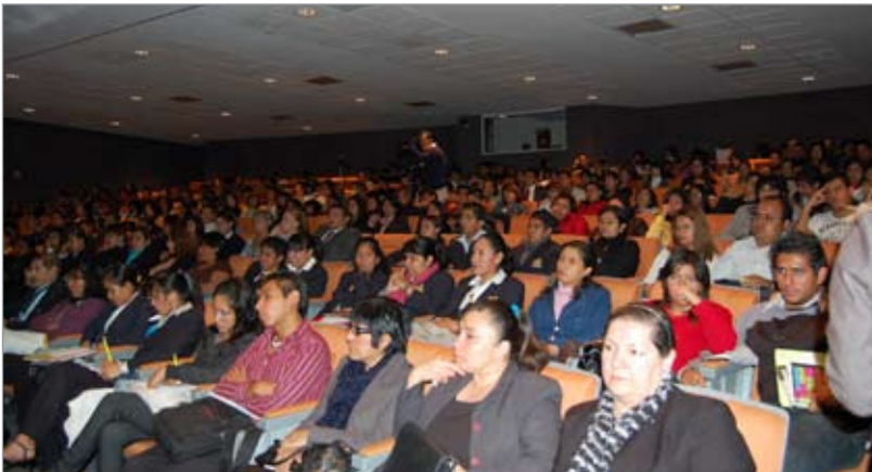
Conferencia "Privacidad y Transparencia en Yahoo"

La 5ª Semana de Transparencia: "Seguridad en Internet" se llevó a cabo con sedes en el Tecnológico de Monterrey, la Universidad Iberoamericana y la Universidad de las Américas Puebla y con la participación de Yahoo México, Navega protegido en Internet, Microsoft y la Asociación Mexicana de Internet (AMIPCI). En dicho evento se contó con mil 200 participantes en las diferentes actividades realizadas, las cuales registraron llenos totales.